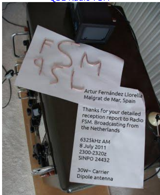
Radio FSM, 6325 KHz, pirata holandesa.