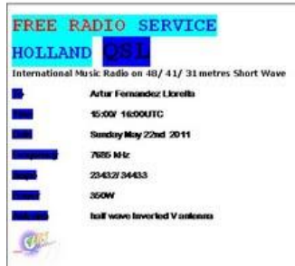
Free Radio Service Holland (FRSH), 7685 KHz, pirata holandesa