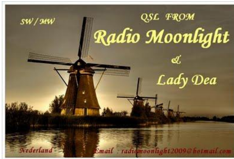
Radio Moonlight, pirata holandesa, 6305 KHz.