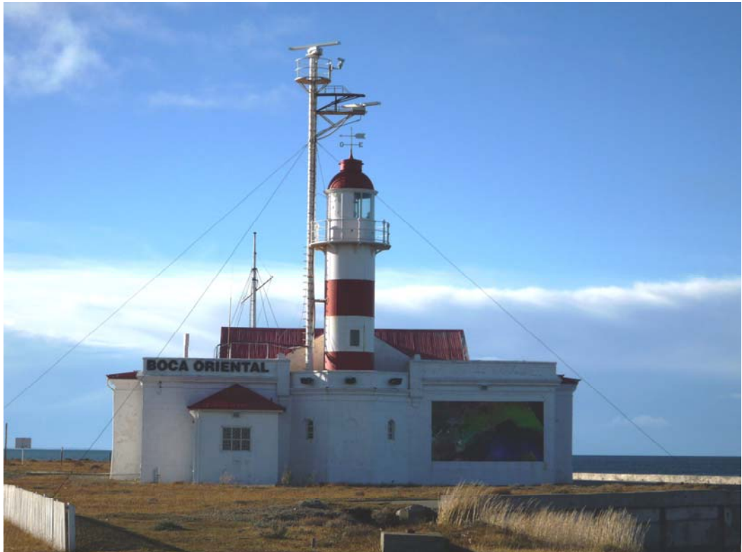
Fotografías tomada por Patricio de los Ríos CA6UQT, al faro "Boca Oriental" en el estrecho de Magallanes 52^{\circ}27'21.00'' S / 69^{\circ}32'42.38'' O