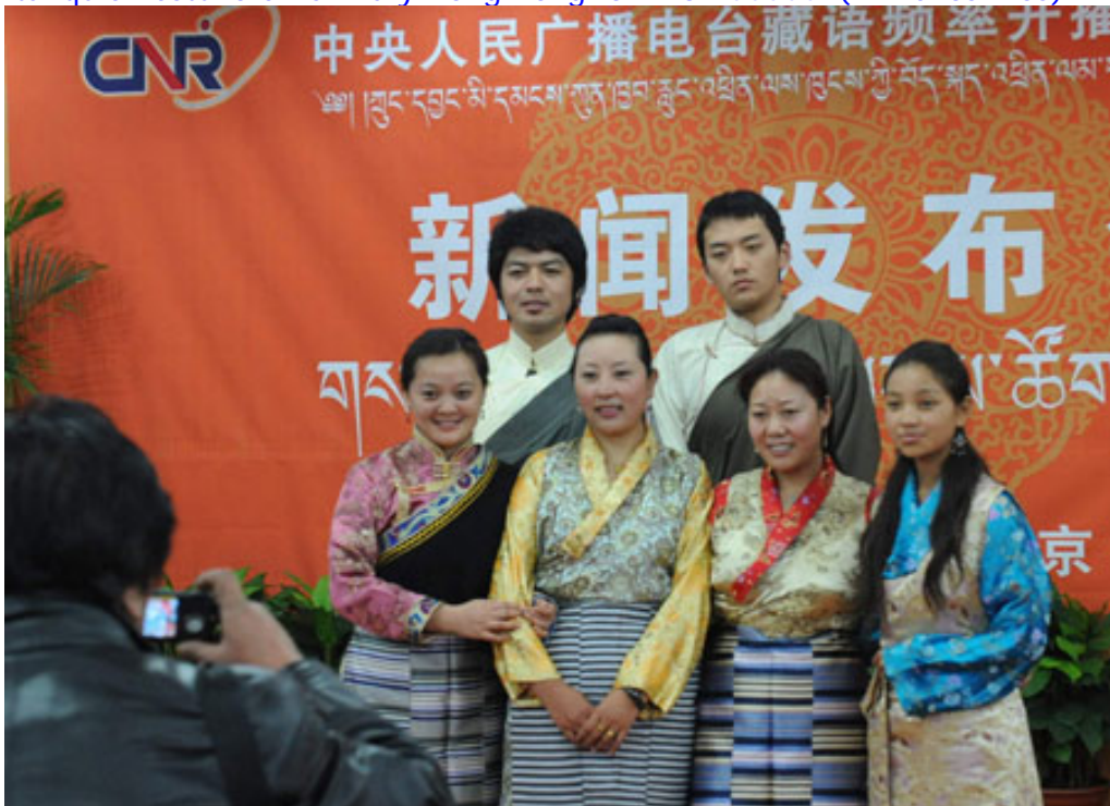
TIBETAN RADIO SECTION, CHINA NATIONAL RADIO

9590, Radio Internacional de China, 2130. Programa en inglés con noticias de un viajero occidental quien estuvo en China y Hong Kong. SINPO: 44444. (P. De los Ríos).