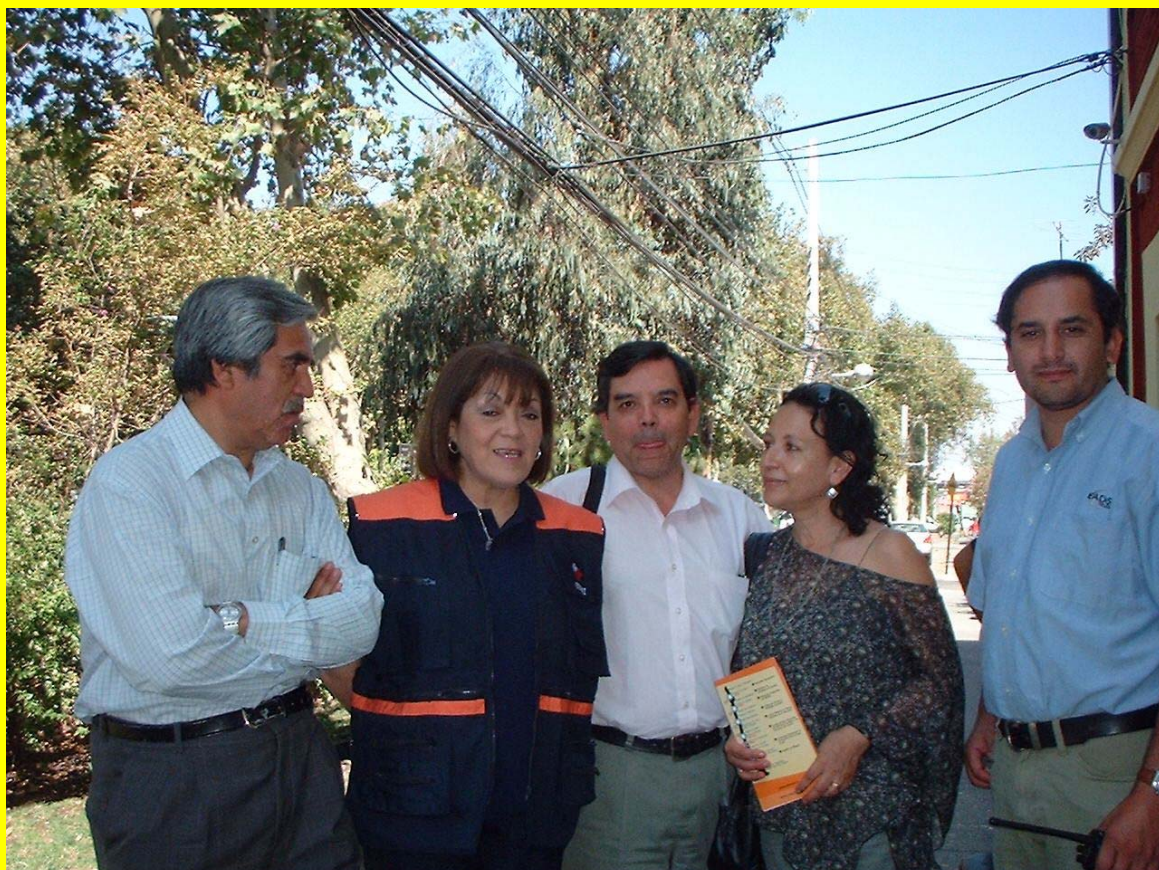
FOTOGRAFIA CAPATADA EL PASADO 22 DE MARZO 2009, EN LA ENTRADA DEL EDIFICIO DE ONEMI, EN LA CIUDAD DE SANTIAGO, CON MOTIVO DE CELEBRARSE UN ANIVERSARIO MAS, DE LA OFICINA NACIONAL DE EMERGENCIA CE3REN (CHILE)

TODA LA INFORMACIÓN DE ESCUCHAS ES DE RESPONSABILIDAD DE QUIEN LA REPORTA, Y NO NECESARIAMENTE DEL EDITOR DE ESCUCHAS DEL MUNDO.